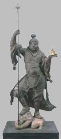
運慶作《毘沙門天立像》、 1189年、国指定重要文化財、浄楽寺蔵