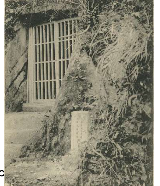
三浦為通・義継廟所 大正8年(1919)