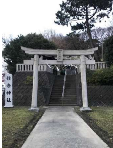
住吉神社(久里浜) 古くは栗浜明神と称され、源頼朝や源頼家が参詣した。