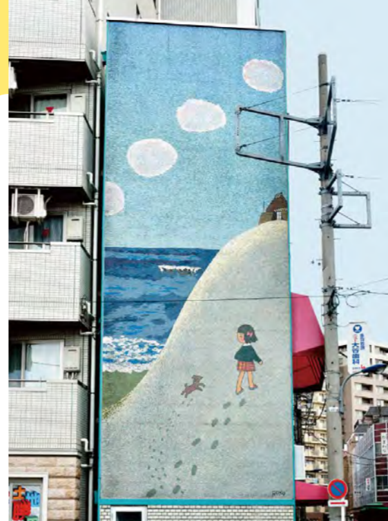
MAP 1 東京都北区・赤羽(赤羽3-5-6) 《砂山》1969年 堀越ビル(旧金竜堂書店)

六郎さんのモザイク壁画としては第2号で、現存するものでは最も古いものと考えられます。現在は書店としては営業していません。建物がある赤羽交差点付近は、1972年まで存在した旧都電赤羽線の終点となっていました。