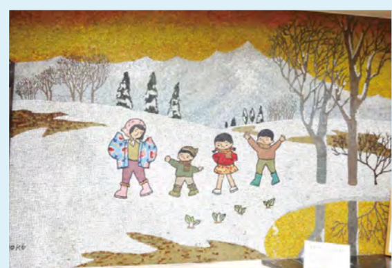
MAP 富山 富山県富山市(総曲輪3-2-24) 《立山の早春》1972年 旧 清明堂書店本店

建物に入るとすぐ左手の壁の上部いっぱいに設置されています。立山連峰を背景とし、雪を割って芽を出す植物と、春の訪れを喜ぶ富山の子どもたちが描かれています。 *現在は「100円ショップ シルク 総曲輪店」として営業しています。