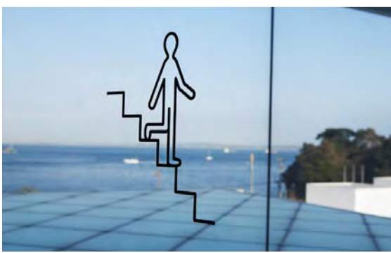
廣村正彰《横須賀美術館ピクトグラム よこすかくん》2007年

美術館を訪ねる楽しみは、展覧会だけではなく、建物の外に設置されている作品や、開館、閉館のときに流れるふしぎな音楽、ひそかなファンも多いピクトグラムなど、横須賀美術館の隠れた魅力をあらためて発見します。