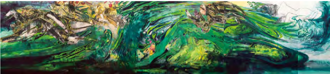
内田あぐり《分水界》2020年 作家蔵