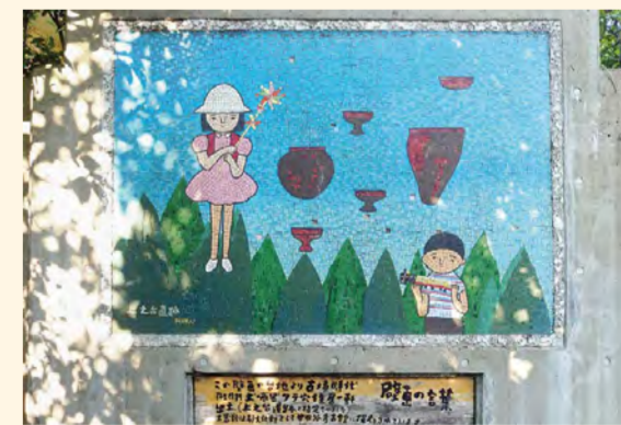
MAP 東京都世田谷区 《上之台遺跡》1979年頃 個人邸

六郎さんは、自宅にもモザイク壁画をつくっています。家を改築した際に水がめや高坏など、弥生時代後期の土器(土師器)が出土したことを記念して、土器と子どもたちを描きました。