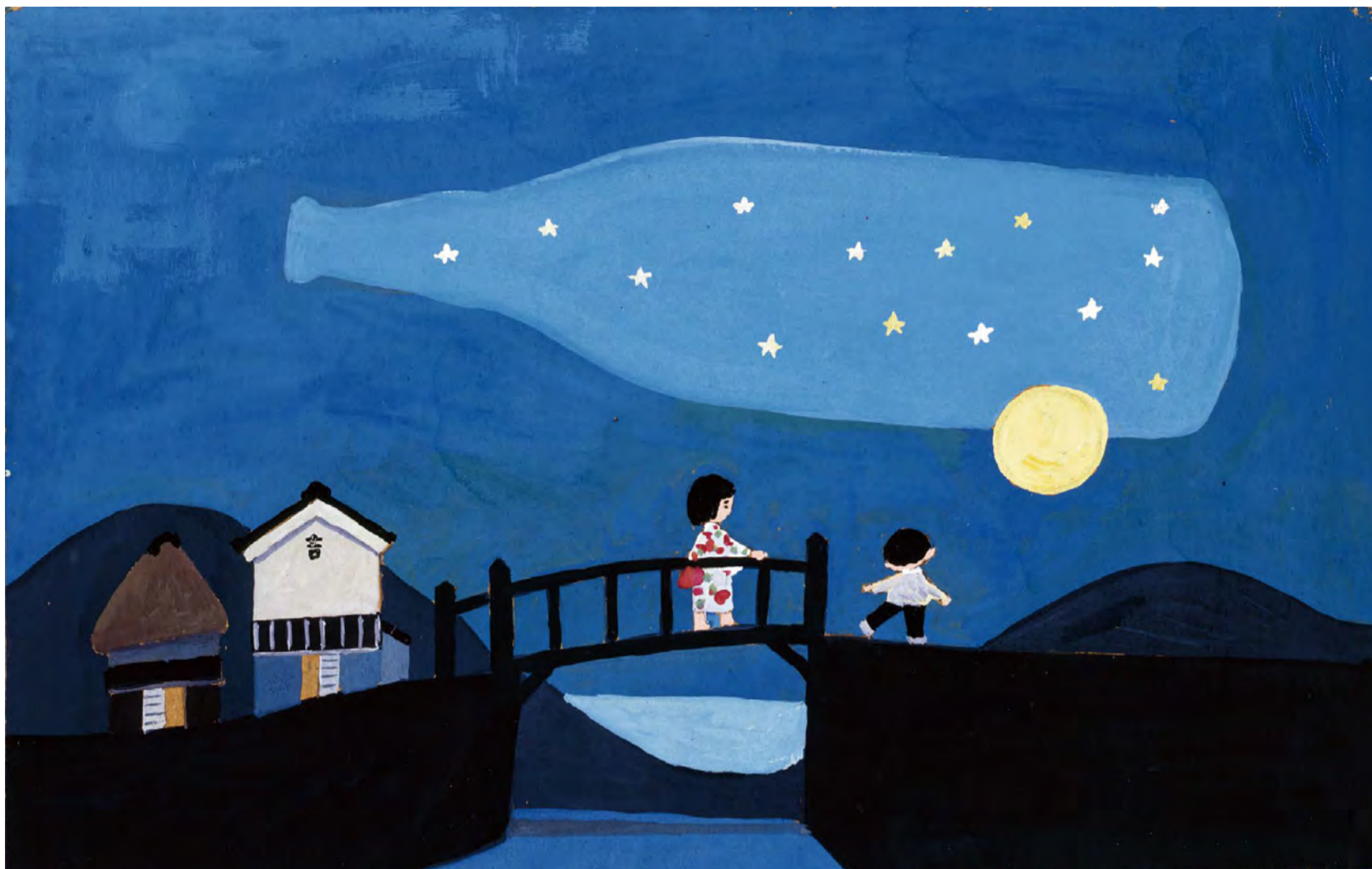
谷内六郎「びんのそら」(「こどものせかい」25巻3号、1972年7月、至光社)より ©Michiko Taniuchi

横須賀美術館の情報は公式TwitterやFacebook、YouTubeでもご覧いただけます。