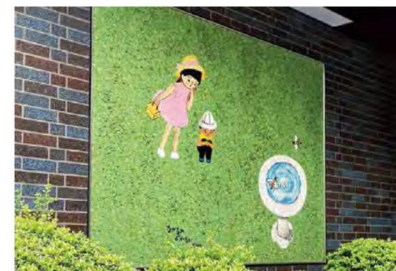
MAP 5 東京都新宿区・神楽坂(矢来町62-2) 《なかなかどかない》1985年 新潮社別館

六郎さんの突然の死を悼み、建物の玄関前に設置されました。原画は、昭和47年版新潮社カレンダーのために描かれたもの。