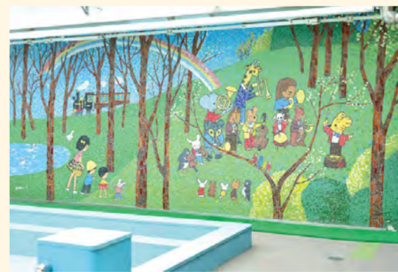
MAP 東京都世田谷区 《動物たち》1979年 松原北保育園内

園内のプールサイドに設けられています。子どもたちが林を抜けていくと、動物たちによる演奏会が行われていました。木々の間をぬって大きな虹がかかり、速くには汽車が走っています。