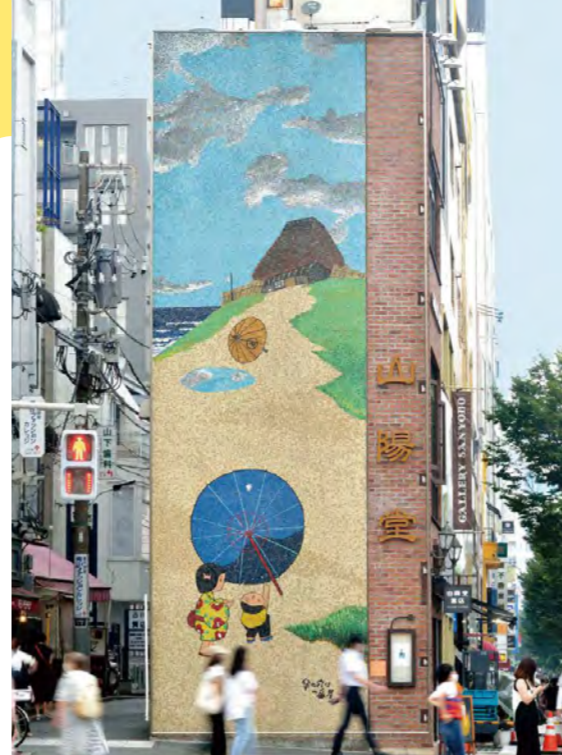
MAP 2 東京都港区・表参道(北青山3-5-22) 《傘の穴は一番星》1975年 山陽堂書店

おしゃれな人々が闊歩する表参道交差点に、ひときわ異彩を放っている巨大壁画。じつは、現在の壁画は2代目で、オリンピック直前の1963年に設置された初代壁画《風船》が、六郎さんのモザイク壁画の第1号でした。