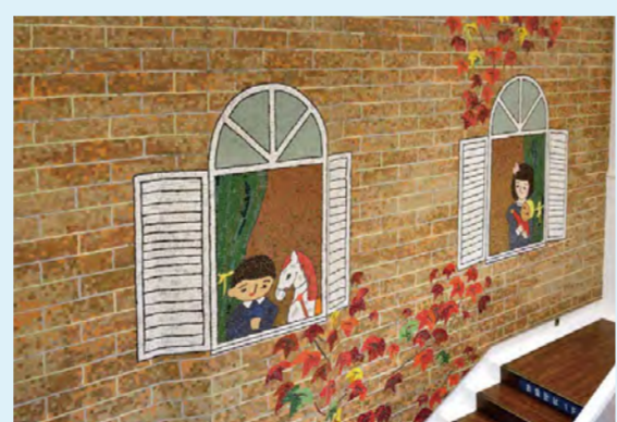
MAP 静岡県 静岡市(南区呉服町2-5-5) 《西洋館の思い出》1978年 旧 谷島屋書店呉服町本店

1階から2階へのぼる吹き抜けの階段の壁面を、レンガ造りの西洋館の外壁に見立てたまま絵風の壁画です。両開きのヨロイ窓からは、子どもたちが顔をのぞかせています。 *現在は「100円ハウス レモン 呉服町店」として営業しています。