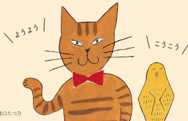
イラスト：樋口たつ乃

アートを楽しむ4つのヒントとは？ ネコの「ようよう」とトリの「こうこう」のコンビが、 美術館の楽しみかたをナビゲートします。