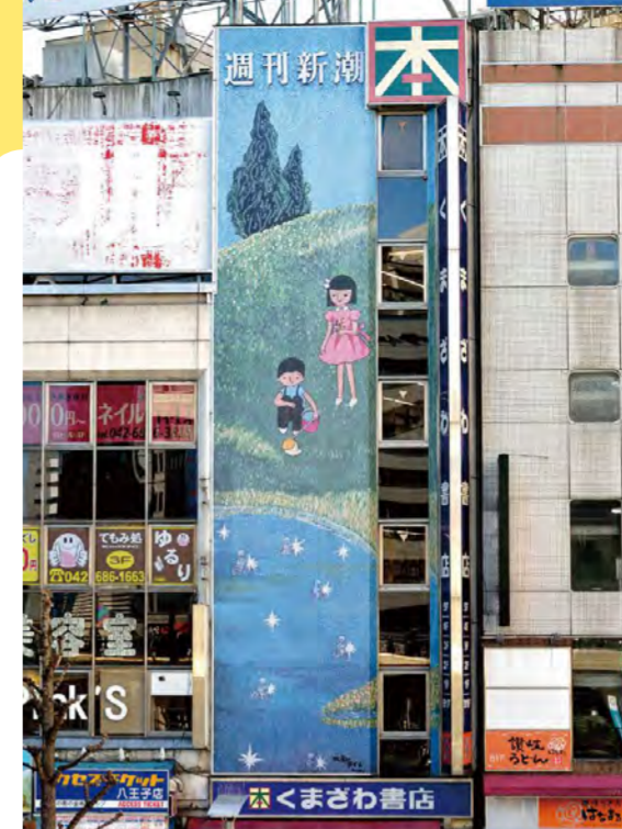
MAP 3 東京都八王子市・八王子駅北口(旭町2-11) 《水面のライト》1975年 くまざわ書店 八王子店

くまざわ書店本店として開店した際に設置されました。八王子駅前のランドマークとして親しまれています。 *モザイク壁画の保護のために、現在は同じ図柄のシートを上から貼り付けています。