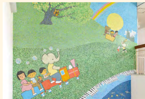
MAP 東京都調布市 《タイトルなし》1977年 京王福祉会双葉保育園内

通常非公開の施設や、個人のお宅にも、六郎さんの愛情あふれるデザインの壁画がのこされています。 *一般の方は敷地内に入れません。外からの写真撮影もご遠慮ください。