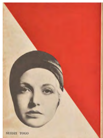
モオリス・デコブラ『恋愛株式会社』1931年 県立神奈川近代文学館蔵、装幀：東郷青児