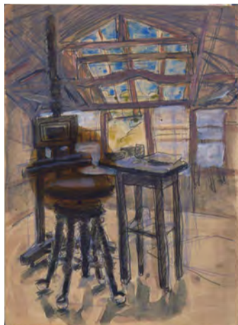
朝井閑右衛門《田浦のアトリエ》制作年不詳 水彩・紙 当館蔵

横須賀市内・田浦のアトリエで、戦後の20年間を暮らした洋画家・朝井閑右衛門。そこから生みだされた作品のほか、当時の写真や身の回りのものから、ユニークなアトリエでの創作のようすを探っていきます。