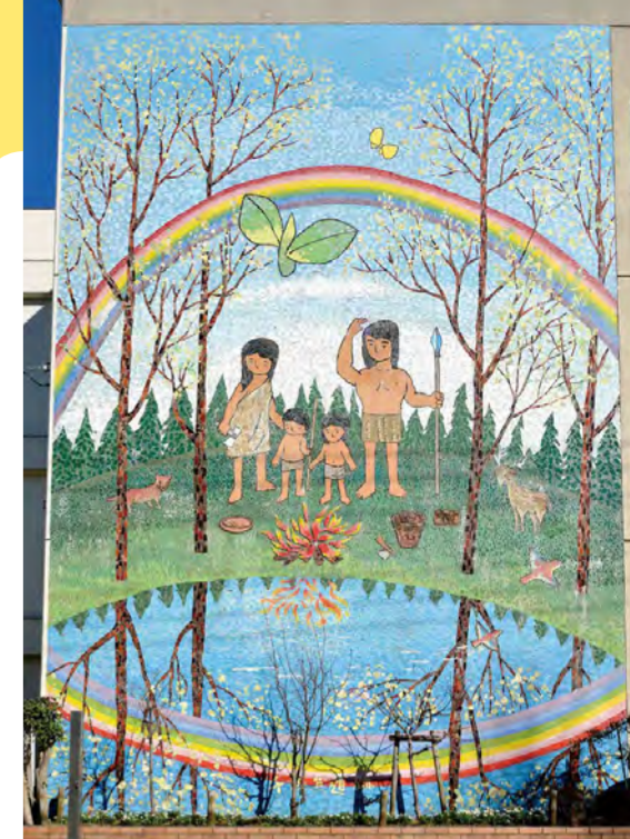
MAP 4 東京都世田谷区(千歳台4-24-1) 《芽生え》1979年 千歳台小学校

千歳台小学校の開校を祝って制作された壁画です。小学校を建設する際に発掘調査された千歳台遺跡をモチーフとし、水のほとりて平和に暮らす古代人の家族が描かれています。 *小学校の敷地内には立ち入らないでください。