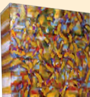
滝波重人《汽水域04-C-8》2004年 作家蔵

美術館で見る作品は、どのように生み出されているのでしょうか？作品の素材や技法に注目しながら、5人の現代作家の制作のプロセスをたどります。また、横須賀美術館のコレクションをつかったアートカードや、触図などの鑑賞教材をご紹介します。