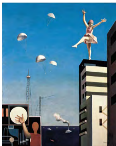
古賀春江《窓外の化粧》1930年 油彩・カンヴァス 神奈川県立近代美術館蔵

20世紀のはじめ、ヨーロッパで次々におこった新しい芸術運動は、大正から昭和にかけて、日本の若い文学者、美術家の心を大きく揺さぶりました。1920～30年代のモダニズム絵画と、画家が手がけた装幀を通じて、美術と文学の活気のある交流を見ていきます。