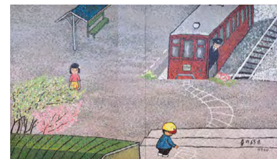
MAP 6 東京都世田谷区(站公園1-2) 《春の終点》1981年 世田谷美術館内

もともとは、横尾忠則さんが発起人となって企画した「谷内六郎全国縦断回顧展」のために制作されたもの。その後谷内家から世田谷区に寄贈され、1986年の世田谷美術館開館時から地下1階創作広場に向かう通路に設置されています。