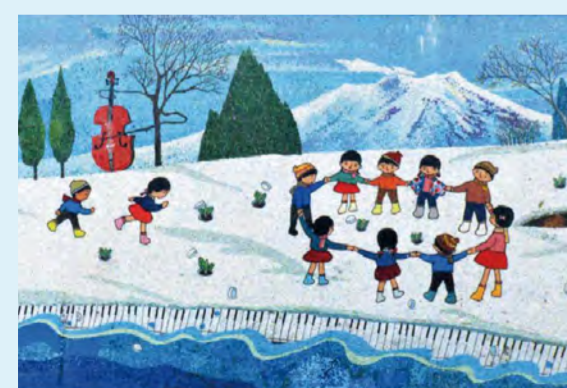
MAP 北海道 小樽市(旭町3-1-12) 《芽の出る音》1972年 苫小牧市科学センター

北海道の長い冬が終わり、雪を割って植物が芽を出す春が訪れました。木の枝を鳴らす春風が弦楽器の音に、砂浜に寄せる波がピアノの演奏に見立てられ、子どもたちが輪になって踊ります。センターの開館を祝って、中村重信氏から寄贈されたもの。