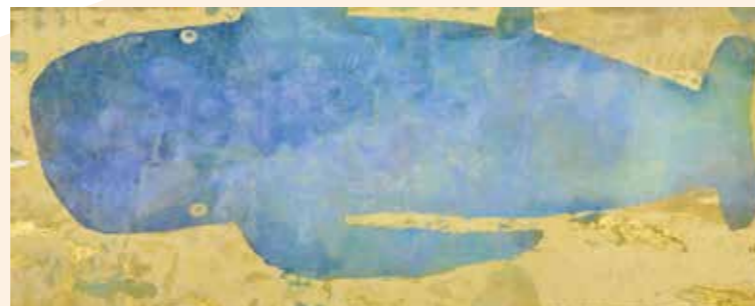
(アエソプ)2018年、公益財団法人 麗仙洞蔵