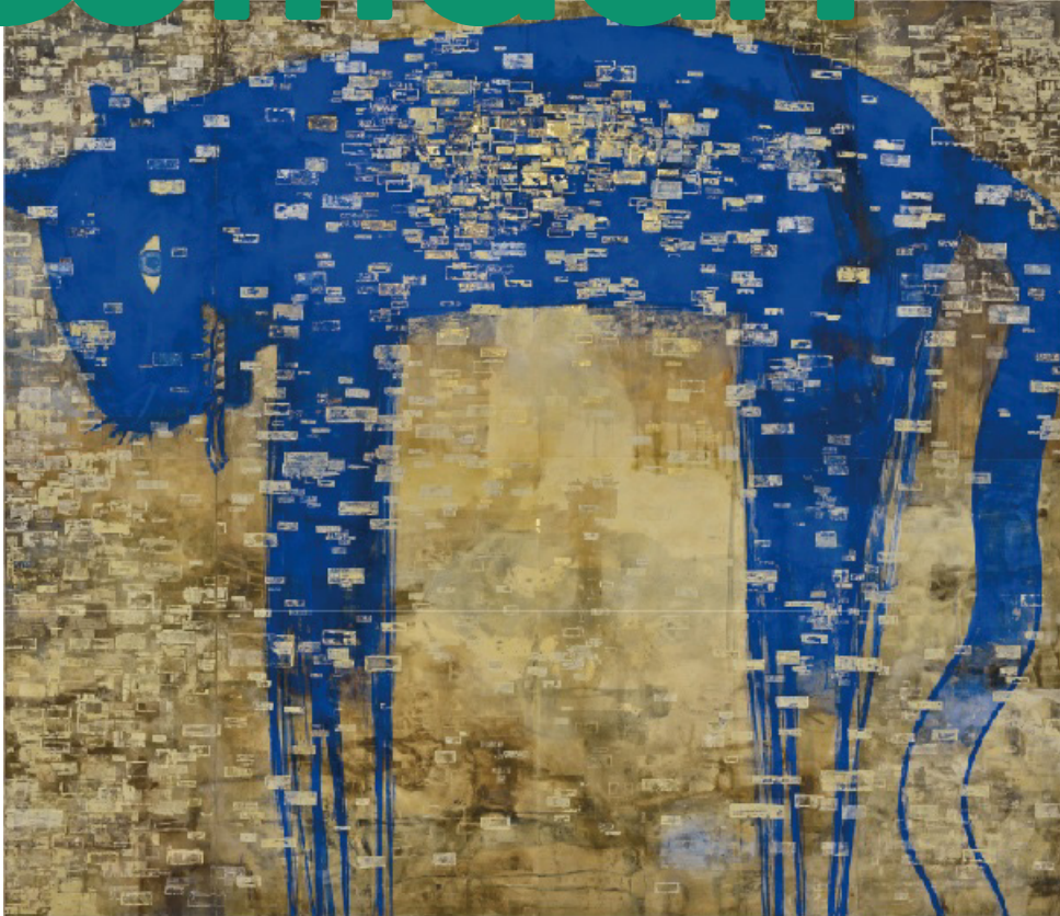
長沢明 (Motohiro Nagasaki) 2019年 公益財団法人 聖仙洞蔵