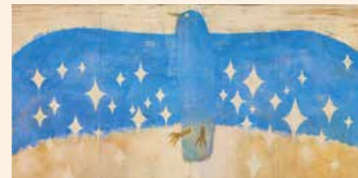
(ブルーバード)2013年、作家蔵