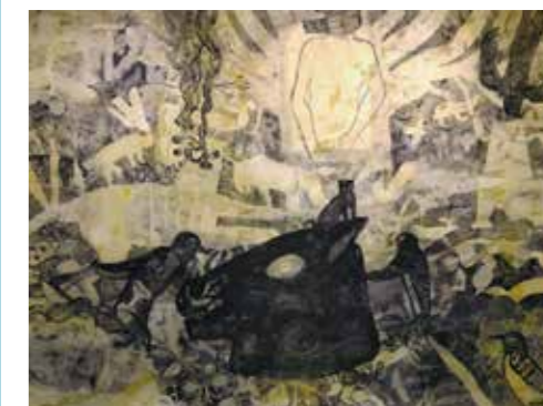
(メメントの森)2019年、作家蔵

メメントモリからきている。動植物も人間も渾然一体となり、あらゆるモノの視点が交差する森。涅槃図でもユートピアでもない。何がどう出てくるのかは、現時点でもわからないけれど、現実に関わってきた風景を絵の中でつなぎ合わせながら描いていくと、何かが起こるんじゃないかと。考え過ぎず、絵にし過ぎないことが前提。そのためには短期間で一気に描く必要があると感じている。