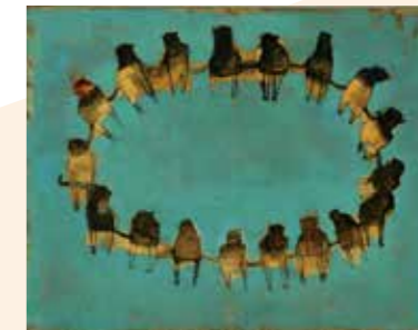
(トララララ…)2008年、塚越雅彦蔵