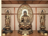
運慶《木造阿彌陀如来及両脇侍像》 1189年、浄楽寺蔵