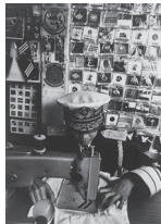
森山大道《ヨコスカ》1965年、当館蔵 ©森山大道写真財団

令和5年度に新たに収蔵した森山大道「ヨコスカ」をはじめ、川田祐子、島田章三、石川忠一、中村光哉の作品を展示します。