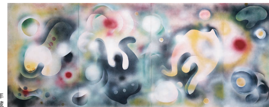
瑛九《カオス》1957年 東京都現代美術館蔵

観覧料 一般：1,300(1,040)円 高大生、65歳以上：1,100(880)円