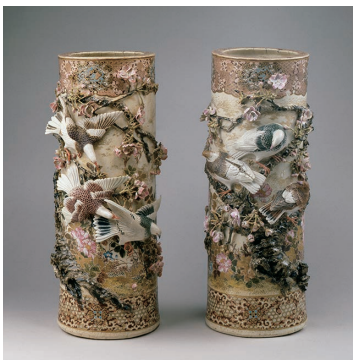
初代 宮川香山《高浮彫彩二群嶋花瓶》 明治4-15年、田邊哲人氏蔵(神奈川県立博物館寄託)

観覧料 一般：1,300(1,040)円 高大生、65歳以上：1,100(880)円