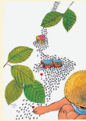
《ラッシュアワー》 1978年、当館蔵 ©Michiko Taniuchi