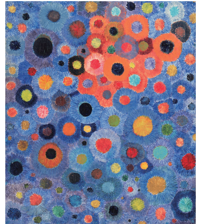
瑛九《花》1956年、埼玉県立近代美術館蔵