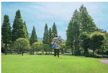
彫刻の森美術館—屋外展示場

一般：2,000(1,600)円 高大生、65歳以上：1,800(1,440)円