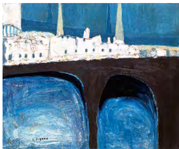
菅野圭介《哲学の橋(ハイデルベルク)》1953年 個人蔵

戦前の独立展に彗星のごとくあらわれ、独特の色彩感覚と豊かなマチエールで人々を魅了した洋画家・菅野圭介(1909-1963)の画業をふりかえります。新発見の作品を含め、約100点を展示する本格的な回顧展。