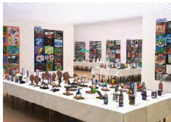
第62回の展示会場風景 2010年

市立の幼・小・中・高・ろう・養護、すべての学校園の子どもたちが日頃の授業でつくりあげた平面作品・立体作品・共同作品など約3000点を一堂に展示いたします。