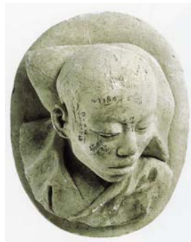
(左) 正岡子規《床の間写生図》