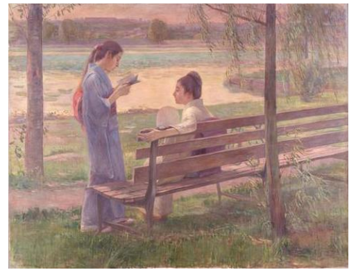
(左) 黒田清輝《残雪》1892年 東京国立博物館